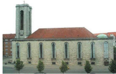
Skt. Lukas Kirkeplads 1, Aarhus